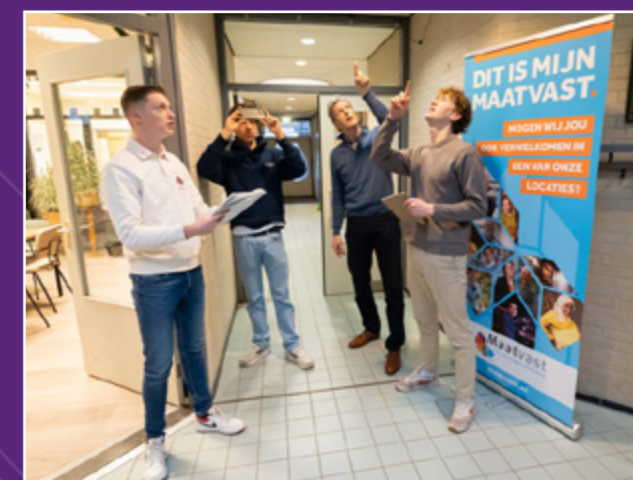
Studenten aan het scannen in De Amazone